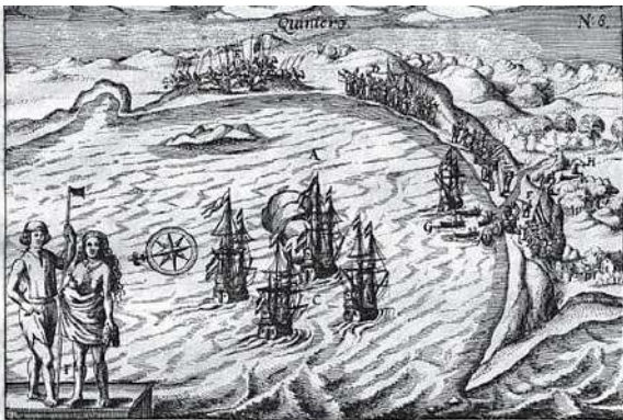
Bahía de Quintero por Van Spilbergen.

"Hoy 24 de Noviembre, Quintero celebra su Aniversario N° 160 de la creación de Puerto Mayor, bajo Decreto Presidencial N° 233 del Presidente José Joaquín Pérez, dado la contingencia de la guerra contra España, fecha que el Puerto de Valparaíso sufría el bloqueo español".