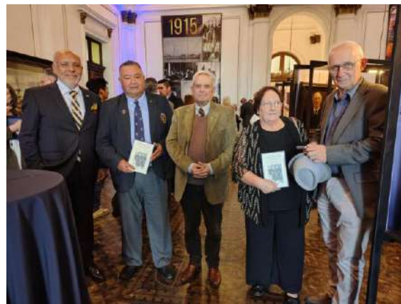
Autora firmando libro...