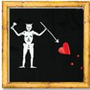
Edward Teach "Barba Negra"

Uno de los primeros piratas que usó esta bandera fue el famoso Edward Teach (Barbanegra).