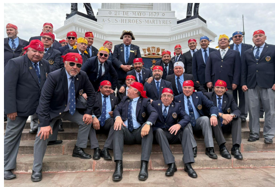
Desde el monumento a los héroes y disfrutando este gran desfile, el Capitán Salmón y el Hermano TBC