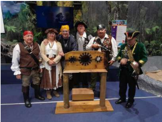
ayer y hoy.