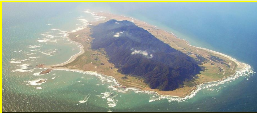
La Isla Mocha observada desde el Sur

Mi interés por la Isla Mocha es producto de un incidente fortuito mientras navegábamos a vela, con otro destino. Las exigentes condiciones de mar y viento nos obligaron a buscar sotavento en ella, entre la Isla y el continente.