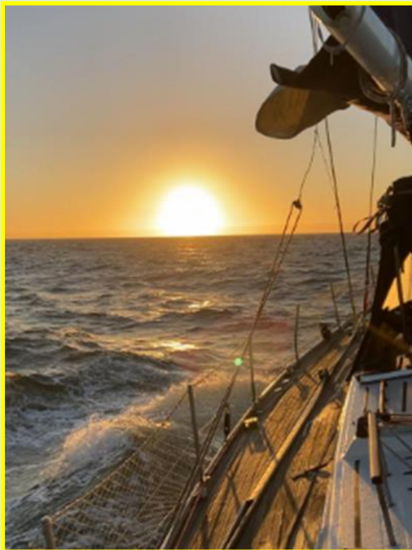
El autor en el timón al amanecer

Con preocupación vi que la profundidad no aumentaba y al revés de repente apenas teníamos no más de cinco metros bajo la quilla y ya estábamos a tres millas de la costa. Pudimos verificar que la zona de bajo fondo se extiende hasta 9 millas de la costa, y hacia el continente de la Isla, en donde la meseta oceánica adquiere una mayor profundidad, algo así como un canal en donde la corriente adquiere la mayor velocidad. Estas características topográficas provocan una ola que es desordenada, de gran altura y velocidad. Por otro lado, a simple vista se apreciaba una larga corrida de bajos que seguían la conformación hacia el sur de la isla, lo que me hacía suponer que ir muy cerca de esa zona bien podríamos encontrar zonas de menos fondo en donde la ola crece aún más y revienta, lo que efectivamente ocurrió.