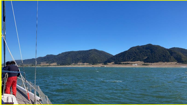
Anclados en el costado oriental de la Isla.

Repentinamente recibimos un fuerte viento desde el este, que terminó con la buena amura que llevábamos y en pocos minutos otro fuerte viento en dirección sur este, o sea en dirección exactamente opuesto al rumbo que llevábamos y al destino que pretendíamos. Este brusco cambio de viento era algo que nunca había experimentado y el capitán con los años de navegación dijo sólo haberlo experimentado una vez en el Atlántico. Nos quedaban las alternativas de seguir rumbo al 260° o sea casi al oeste, o la costa.