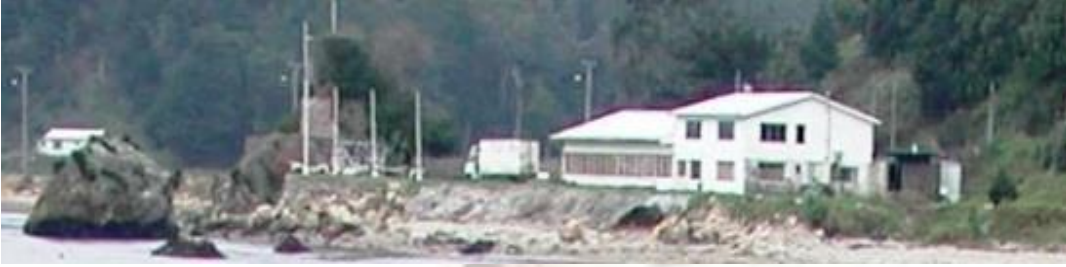
Nostalgia: ex Guarida en Lengua, Nao Talcahuano, triste historia.

Polillas” de Caldera, “La Chorera” de Talcahuano. Las que aún no tienen local propio, arriendan para sus reuniones.