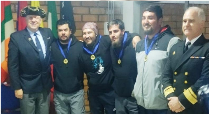
PREMIACIÓN REGATA CAPITÁN IGNOMINATUS CON ALMIRANTE en Thno.

Son la máxima autoridad ejecutiva de una Nao, concentran todas las atribuciones. El Capitán es sabio, debe ser obedecido y respetado a ultranza y en esto se radica el éxito de la institución.