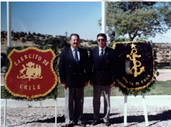
HOMENAJE a PRAT en Ninhüe con LENGUADO