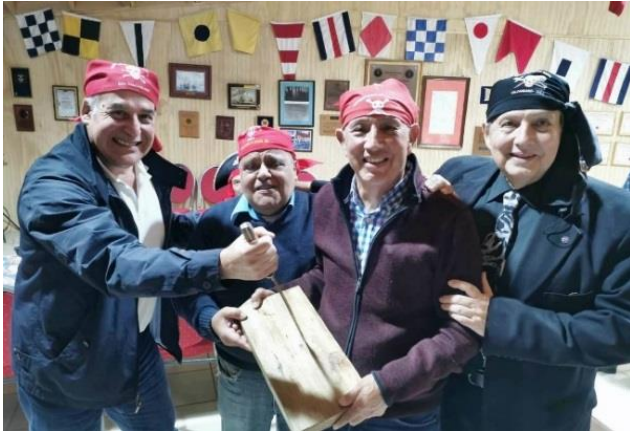
MONTAÑES Y CHUPON ATÓMICO CLAVAN PUÑAL a MAESTRO.

Con GRILLETE DE ORO, ESTRELLA DE ORO, ANCLA DE ORO, TIMON DE ORO, INSIGNIA DE ORO, Título de GENTIL HOMBRE DE MAR, PATENTE DE CORSO, HERMANO DESTACADO otorgados por diferentes méritos. A nivel de Nao hay otros premios ocasionales por alguna acción puntual con CLAVADO DE PUÑAL.