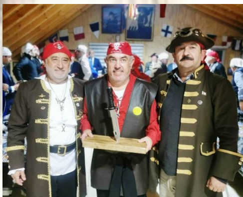
Clavado Puñal ( Premio) a ARENQUE, por PERISCOPIO y ACOLLADOR en Nao Talcahuano.