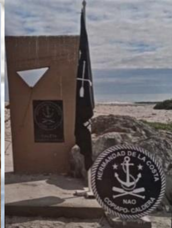
PIRATARIO BAHÍA SALADO, COPIAPÓ