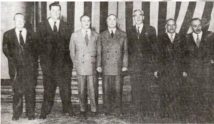
Fundadores de la Hermandad de la Costa

Si, nace en Santiago en 1951, ideada en tertulias de 7 amigos que practicaban deportes náuticos y decidieron unir en una fraternidad a quienes también albergaran tal cariño al mar.