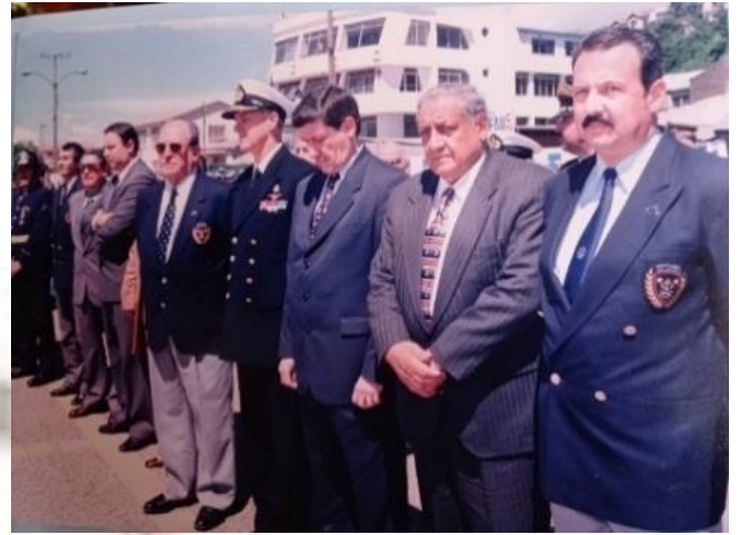
ACTO CIVICO-MILITAR CAPTURA REINA FRAGATA MARIA ISABEL, NAO TALCAHUANO CON ALTAS AUTORIDADES DE LA ZONA