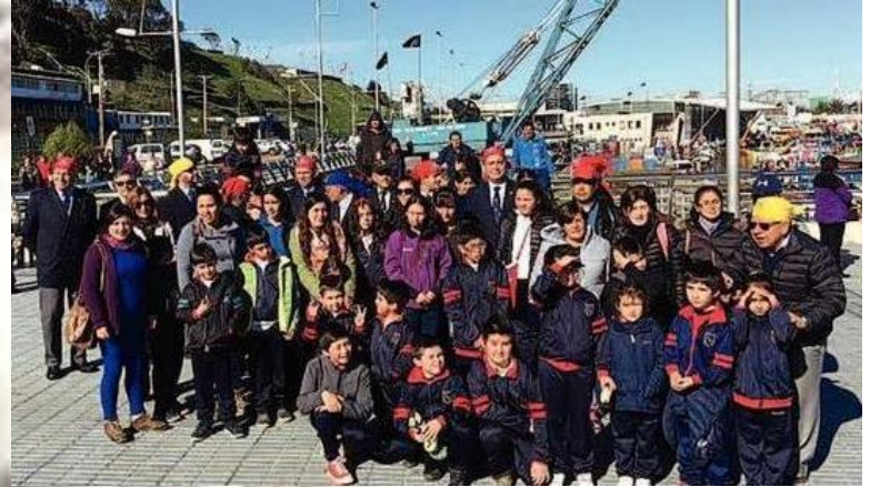
NIÑOS VISITAN PUERTO, NAO SAN ANTONIO