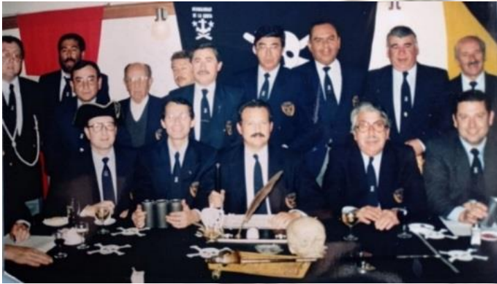
MESA DE OFICIALES, ANTIGUA, NAO TALCAHUANO DE PROTOCOLO

¿CUALES SON LOS OFICIALES Y QUÉ HACEN? El Capitán manda y designa de entre los Hermanos a Oficiales como al Lugarteniente (Vicepresidente); Escribano (Secretario); Comisario (Tesorero); Veedor (Fiscal); Cirujano Barbero (Médico); Contra maestre (Ayudante de Órdenes); Pañolero (Custodio de bienes y enseres); Mayordomo (Alimentación o Rancho).