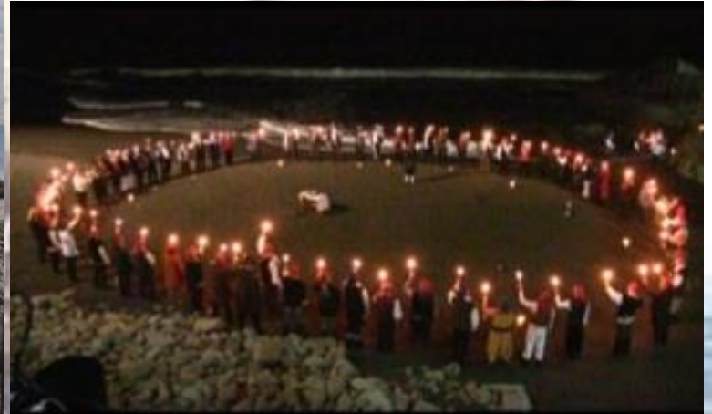
RITUAL PLAYA LOS GRINGOS, NAO CONSTITUCIÓN