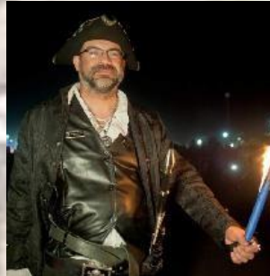
Adº Inform.H.d C HACKER