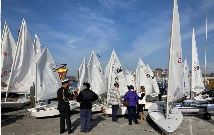
Preparativos para REGATA VELA

Hay 1 Hermana. Hay Zafarranchos, como el PASCUERO al que puede asistir la esposa llamada CAUTIVA o la polola llamada ESCLAVA, y los hijos llamados REMOLQUES, ESCUALOS los varones y SIRENITAS las niñas.