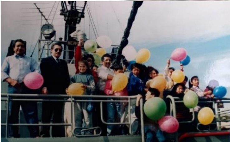
TRAIDA NIÑOS CORDILLERANOS A CONOCER EL MAR, NAO TALCAHUANO