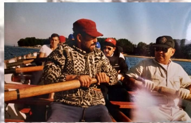
RENACER BOGA: PONYK FOX y ANGIN SAN en Isla Quiriquina