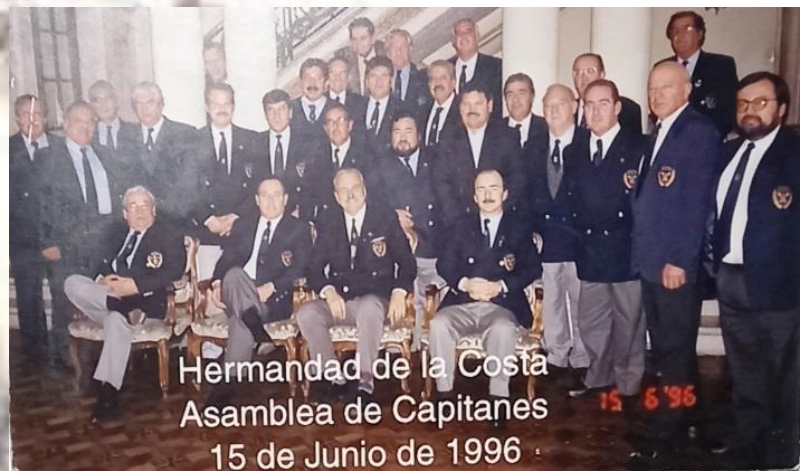
Hermandad de la Costa Asamblea de Capitanes 15 de Junio de 1996