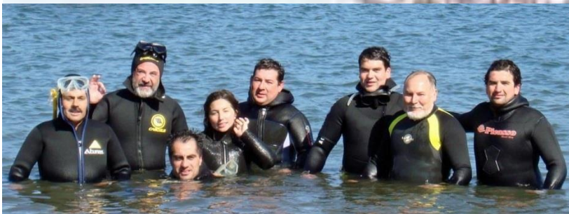
CURSO BUCEO NAOS TALCAHUANO y TUMBES

Depende de cada Nao. Así los VIEJOS LOBOS DE MAR, son hermanos antiguos, cuyo sabio consejo se oye en lo trascendente.