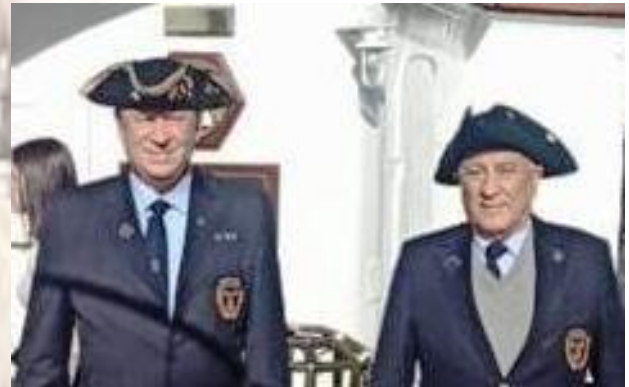
Cp. IGNOMINATUS y Lgtte. Z.S. VIZCONDE en M.H. HUÁSCAR