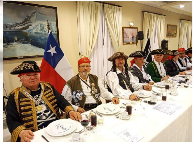
CAMARON Y CAPITANES INVITADOS CAMBIO MANDO VALPARAÍSO, DE COMBATE

¿ESA SUBORDINACION POR SUPUESTO QUE ES SOLO DENTRO DE LA NAO?