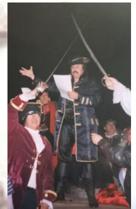
PRIMAVERA EN EL MAR, Nao Thno.