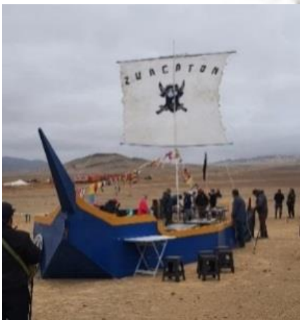
ZUACATÓN, NAO COPIAPÓ-CALDERA