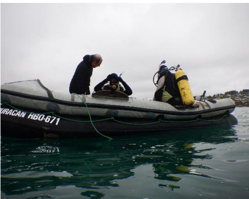
Del grupo de buceo del hermano Nemo