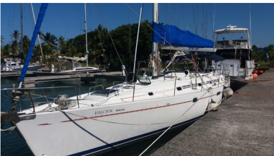
Yate del hermano Barbossa