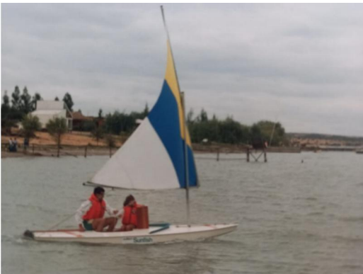
De apoyo familiar de Américo